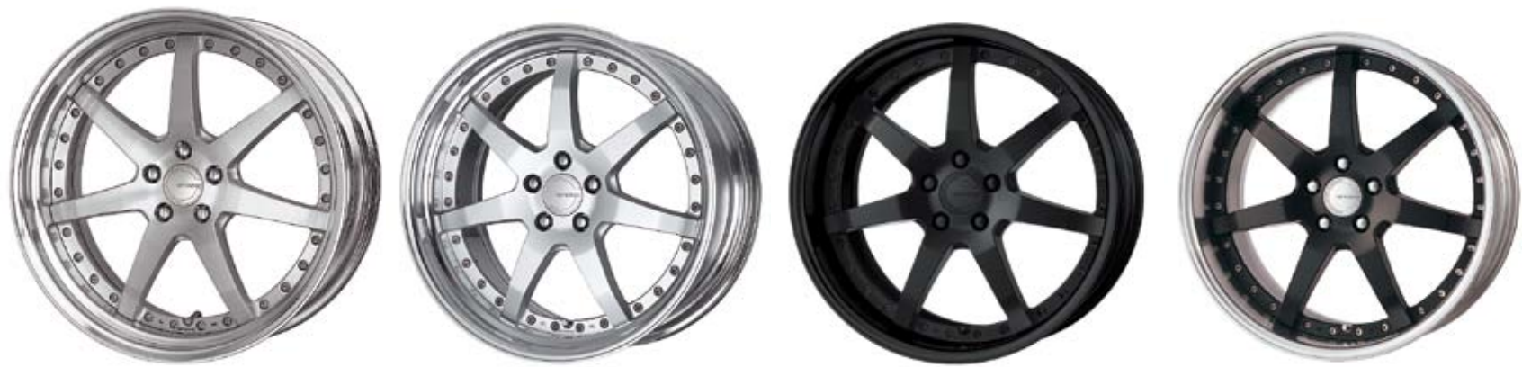
ブラッシュド (BRU) 21 (STEP RIM)

※カスタムオーダープラン対応アイコンの詳細は 各ブランドの最終ページをご確認下さい。