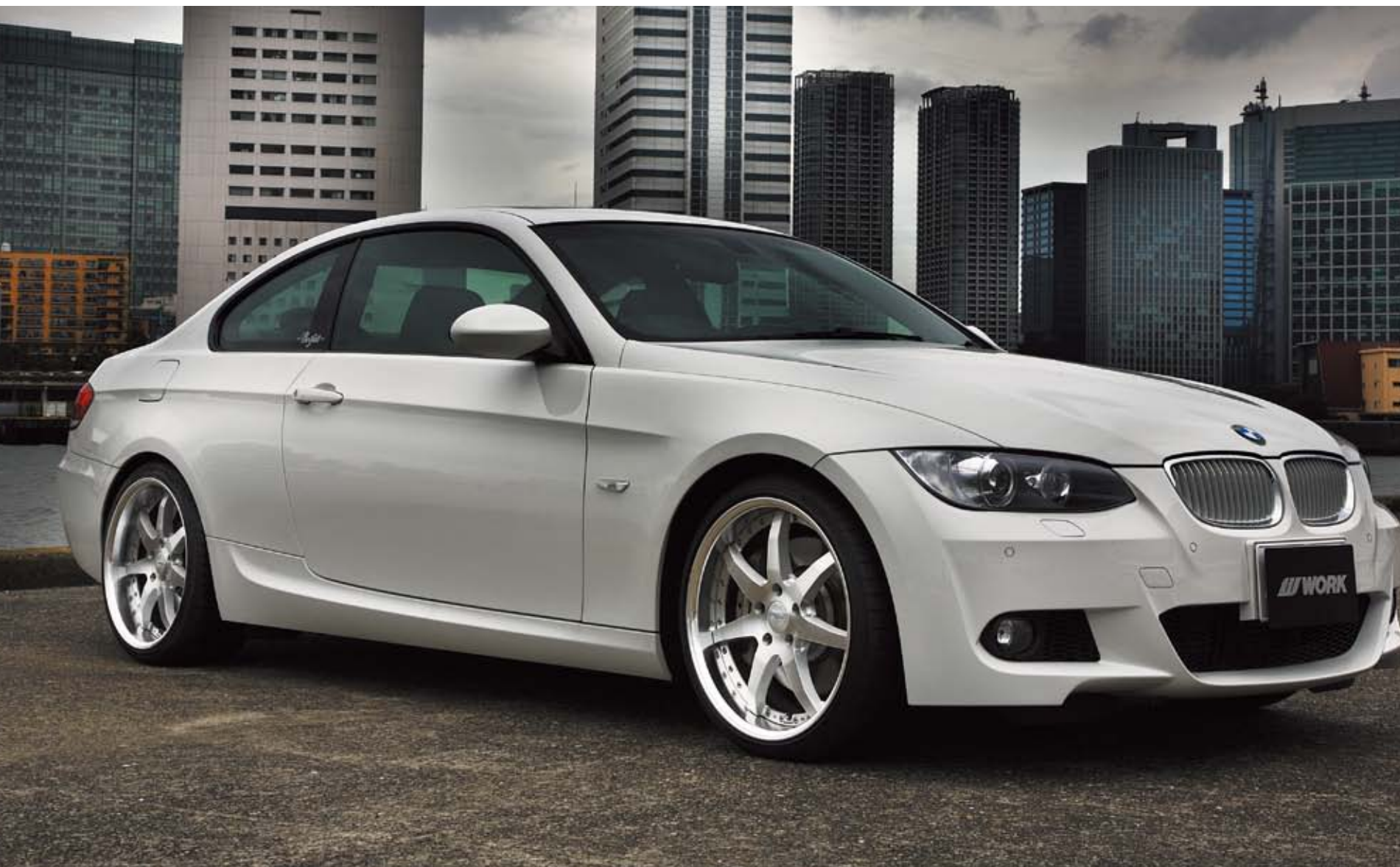
[SIZE] FRONT : 19inch x 8.5J INSET 35mm (O) TIRE : 225/35-19 REAR : 19inch x 9.5J INSET 35mm (O) TIRE : 255/30-19 COLOR : ブラッシュド (BRU) ※フエンダー加工