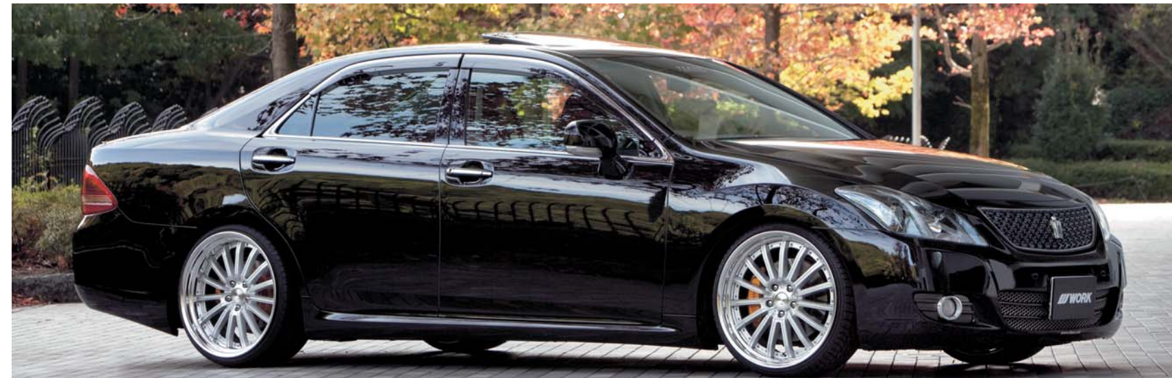
※装着画像はイメージです。