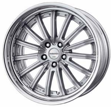
ライトニングシルバー (LS) (STEP RIM) 19