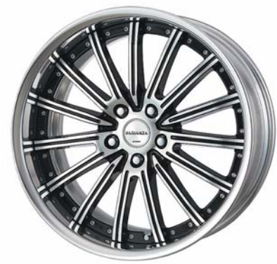
ブラックカットクリア (BP) 19