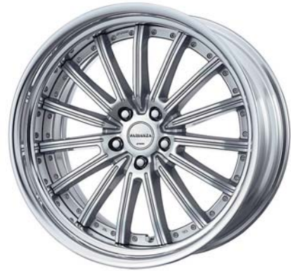
FSカットクリア (FSP) (STEP RIM) 20