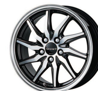
ブラックメタリックカットクリア (BMP2) 15