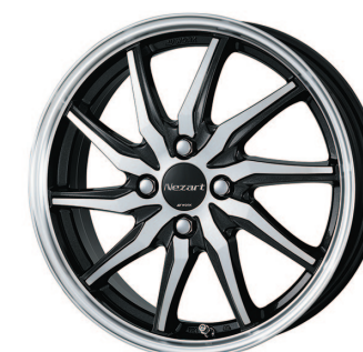
ブラックメタリックカットクリア (BMP2) 16