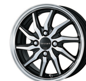
ブラックメタリックカットクリア (BMP2) 14