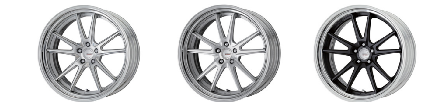
シャンファアバフブラッシュド (SBR) (ディープコンケイブ) (STEP RIM) 21 FORGED ブラッシュド (BRU) (セミコンケイブ) (STEP RIM) 21 FORGED ブラックノダイズド (SKA/B) (ディープコンケイブ) (STEP RIM) 21 FORGED