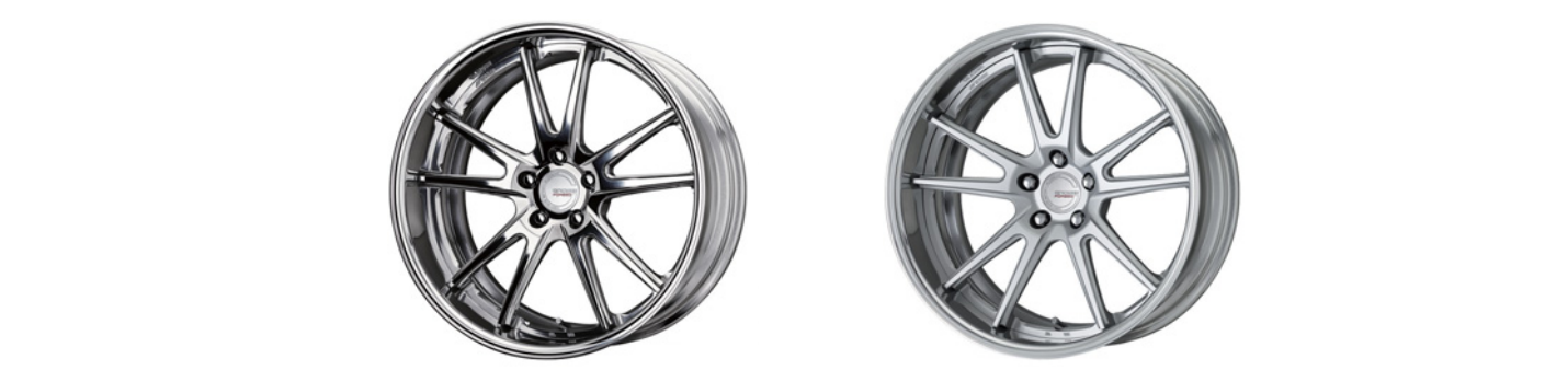
パフフィニッシュ (PP2) (セミコンケイブ) 20 FORGED マットシルバー (MSL) (ディープコンケイブ) 20 FORGED