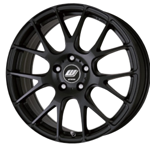
マットブラック (MBL) 18