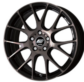
トランスグレークリア (BPA) 18