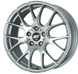
FS カットクリア (FSP) 18