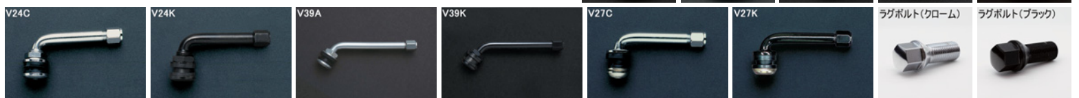
*ラグボルトの詳細について▶P.227