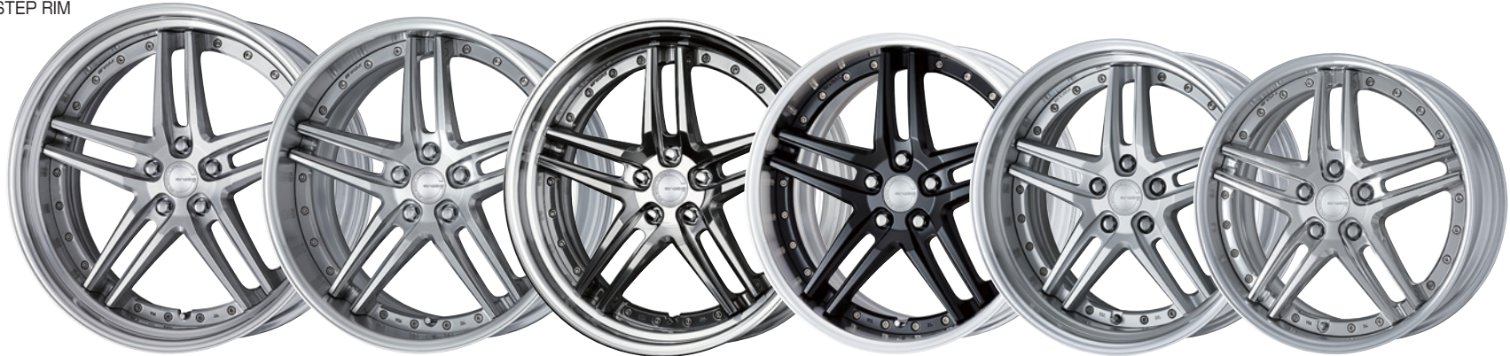
ブラッシュド SR 21