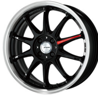
ブラックダイヤカットリム・BLKRC