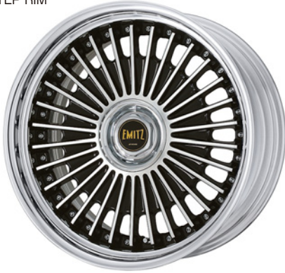
ブラックカットクリア・BP