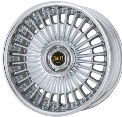
クロームメッキ・C