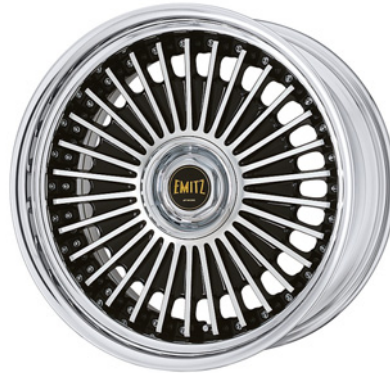
ブラックカットクリア・BP