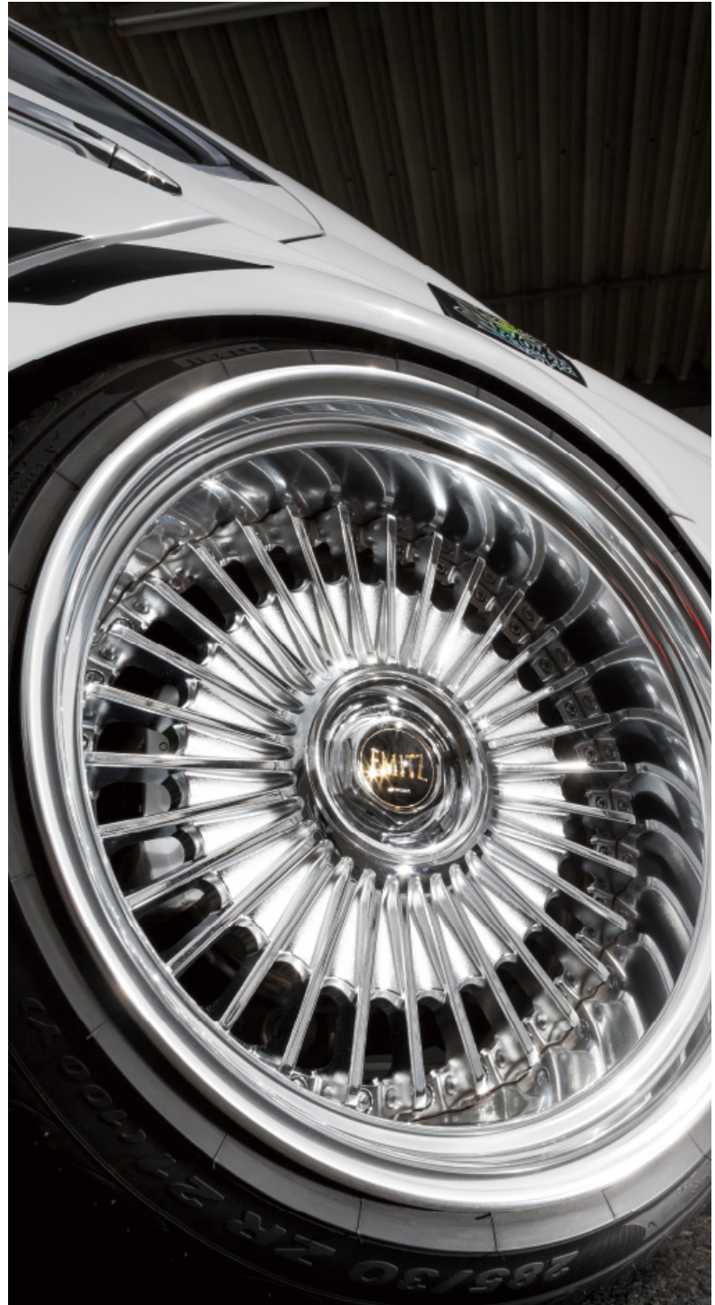
※装着画像はイメージです。