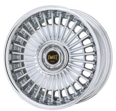
クロームメッキ・C