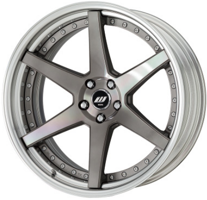
トランスグレーポリッシュ・TGP SR 21 (ディープコンケイブ)