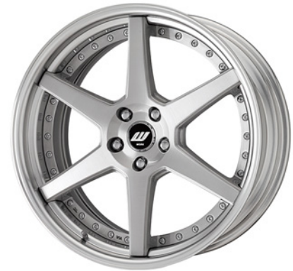
ブラッシュド・BRU SR 20 (セミコンケイブ)