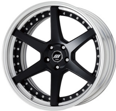
マットブラック・MBL SR 20 (ミドルコンケイブ)