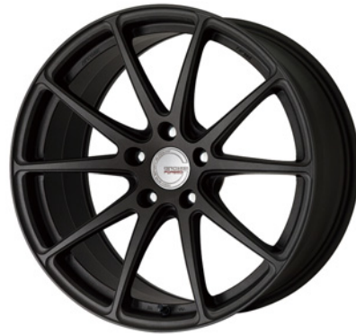
ブラックアノダイズド・SKB 19 (ディープコンケイブ) ブラックエアバルブ仕様