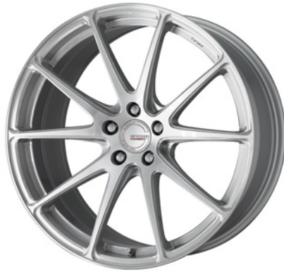
ブラッシュド・BRU 20 (ディープコンケイブ)