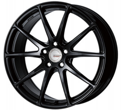
ペイント/ブラック・BLK 19 (ミドルコンケイブ) ブラックエアバルブ仕様