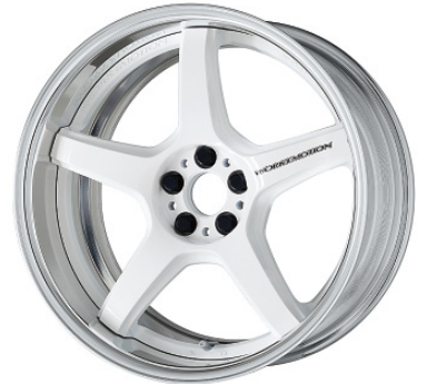
ホワイト・WHT 18 (ミドルコンケイブ)