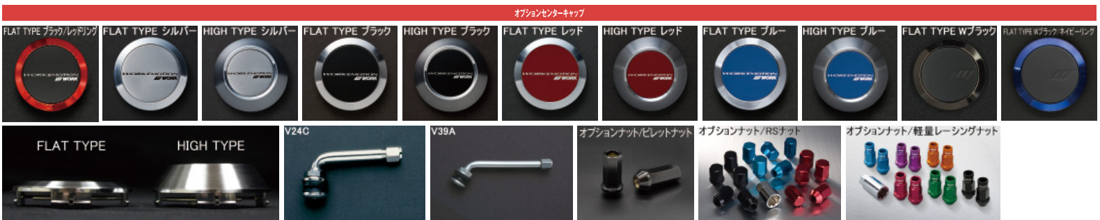
※ナットの詳細について▶P.262