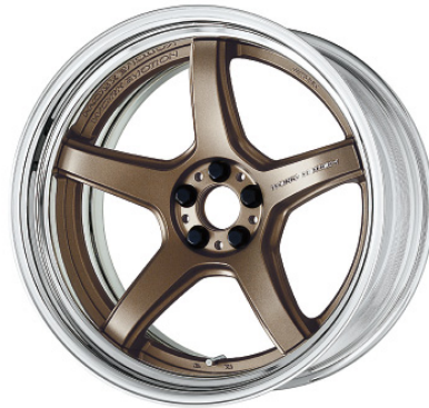
アッシュドチタン・AHG SR 19 (ディープコンケイブ)