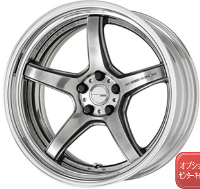
グリミットシルバー・GTS SR 20 (ディープコンケイブ)