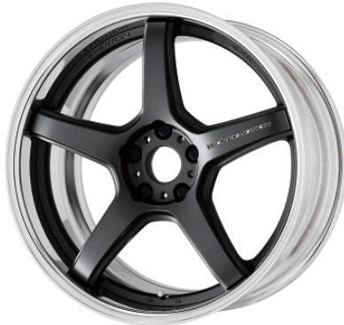
マットカーボン・MGM 19 (ミドルコンケイブ)