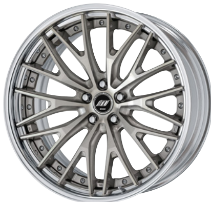
トランスグレーポリッシュ・TGP