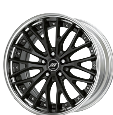
マットブラック・MBL