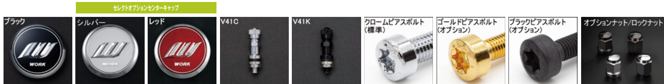
※ナットの詳細について▶P.262