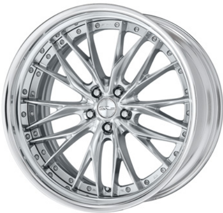
シルキーリッチシルバー・SRS