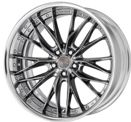
プリリアントシルバーブラック・BSB