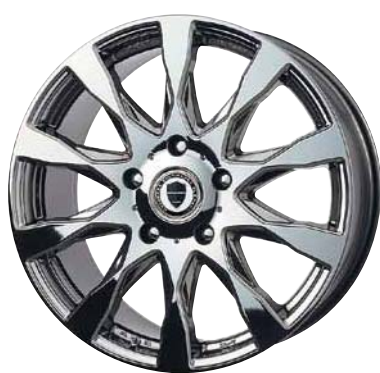
ワークブラックメタルコート (WBC) 20