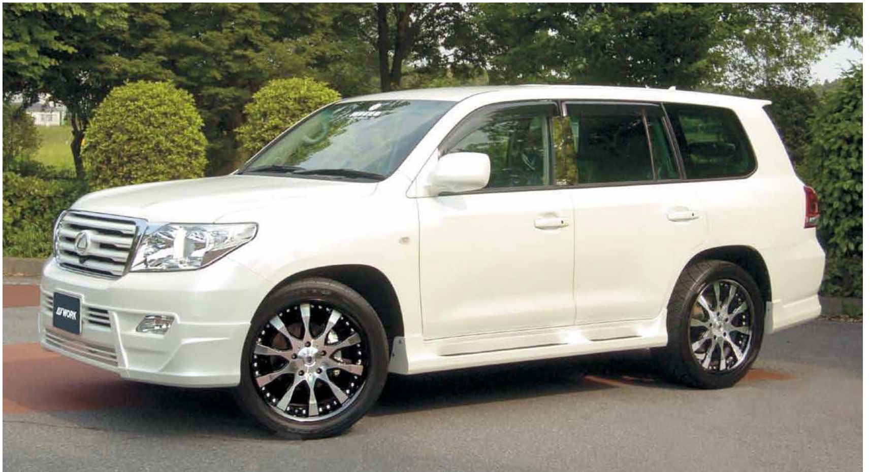
[SIZE] 22inch × 9.5JJ INSET 32mm (A) TIRE : 305/40-22 REAR : 22inch × 9.5JJ INSET 32mm (A) TIRE : 305/40-22 COLOR : ブラックカットクリア (BP) ※フェンダー加工