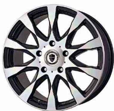
ブラックカットクリア (BP) 20