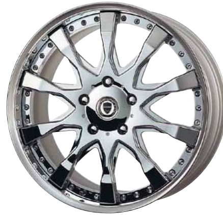
スーパークロームメッキ (SC) 22 FORGED