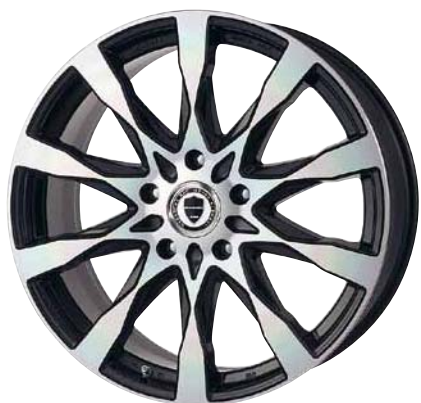
ブラックカットクリア (BP) 22