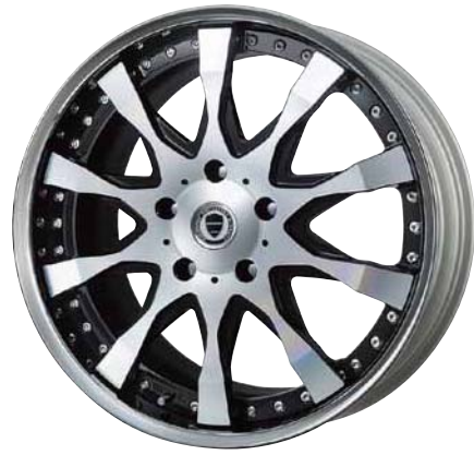
ブラックカットクリア (BP) 22 FORGED