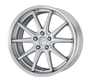
マットシルバー (MSL) (セミコンケイブ) 19