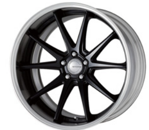
マットブラック (MBL) (ディープコンケイブ) 20