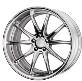
ハーフフィニッシュ (PP2) (セミコンケイブ) 20