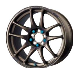
マットチタン (MHG) 17 ディープデーパー