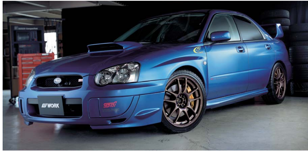
[SIZE] FRONT: 18inch x 7.5J INSET 42mm (ST) TIRE: 225/40-18 REAR: 18inch x 7.5J INSET 42mm (ST) TIRE: 225/40-18 COLOR: マットチタン (MHG) ※フェンダー加工