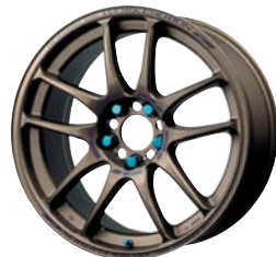
マットチタン (MHG) 18 ミドルデーパー