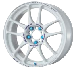
ホワイト (WHT) 18 セミデーパー