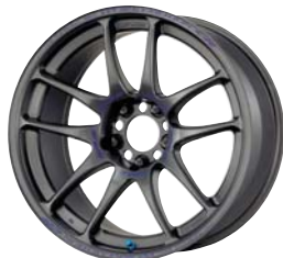
マットカーボン (MGM) 18 ディープデーパー