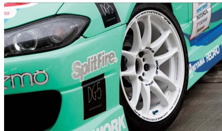
※後部画像はイメージです。