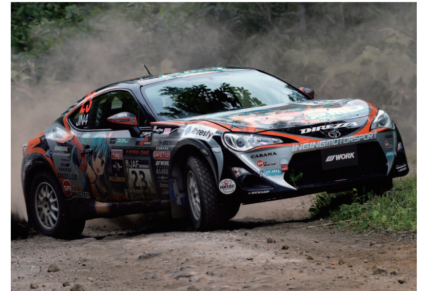
※装着ホイールはコンペティションモデルです。