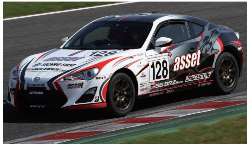
※装着ホイールはコンペティションモデルです。