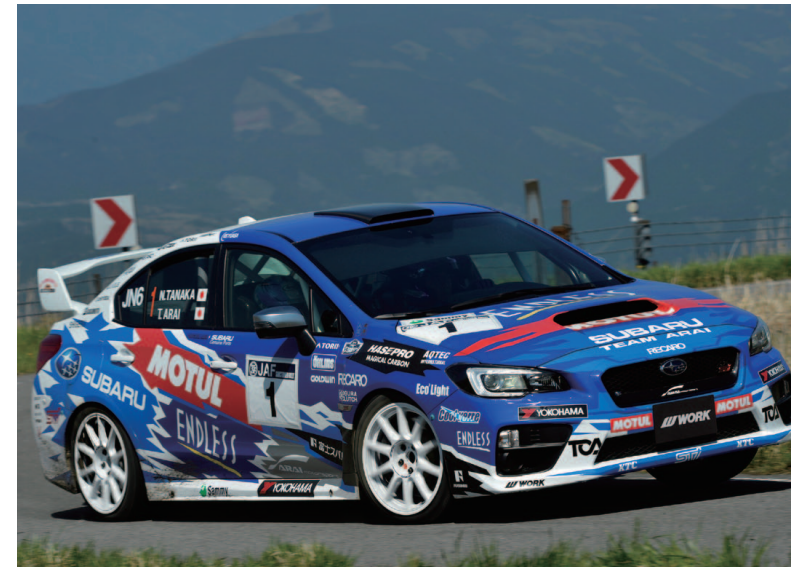
※装着ホイールはコンペティションモデルです。