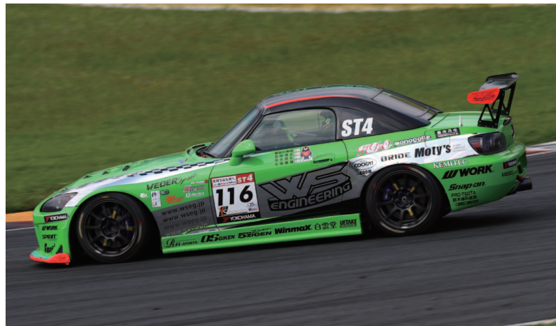
※装着ホイールはコンペティションモデルです。