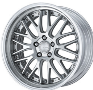
マットシルバー (MSL) 19 (STEP RIM)