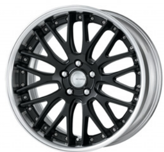
マットブラック (MBL) 19