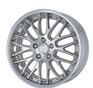
コンポジットパフブラッシュド (PBU) 18