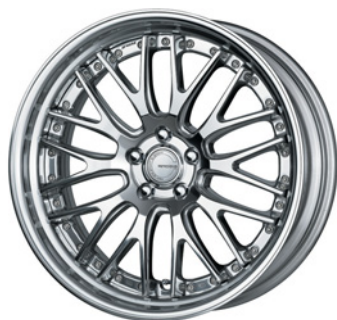
パフフィニッシュ (PP2) 20 (STEP RIM)