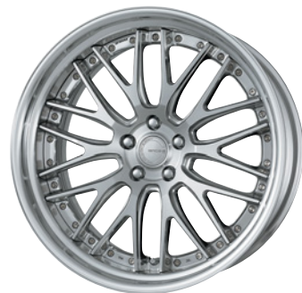
コンポジットパフブラッシュド (PBU) 21 (STEP RIM)