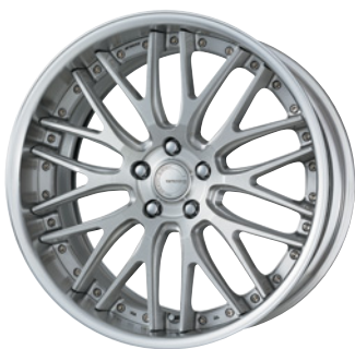
ブラッシュド (BRU) 20