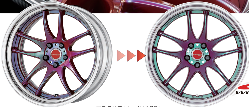
アステリズムレッド(ARR)