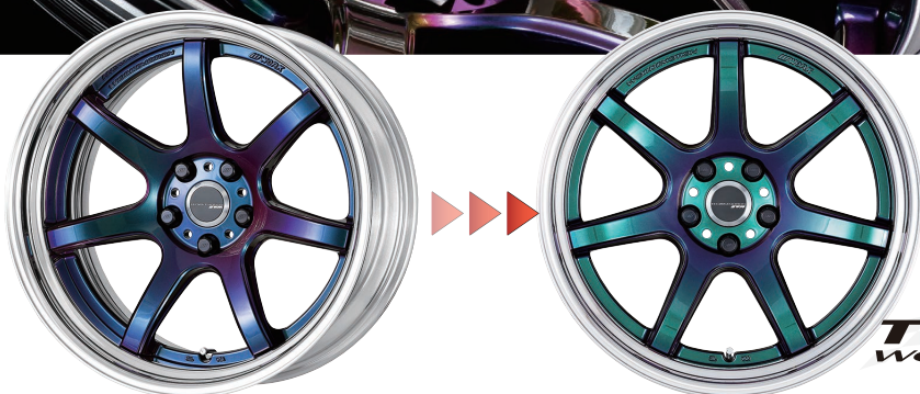
アステリズムブラック(ARK)