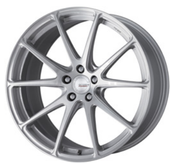
ブラッシュド (BRU) 20 (ディープコンケイブ) FORGED