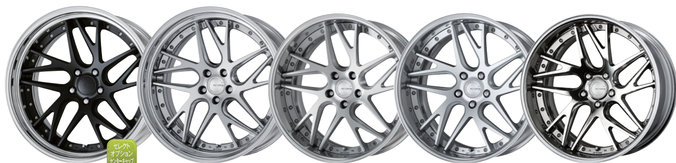
マットブラック (MBL) (ディープコンケイブ) (STEP RIM) 21 | コンポジットハブブラッシュド (P8U) (ミドルコンケイブ) (STEP RIM) 21 | ブラッシュド (BRU) (ミドルコンケイブ) 20 | マットシルバー (MSL) (ディープコンケイブ) 20 | ハブフィニッシュ (PP2) (ディープコンケイブ) 20

※カスタムオーダープラン、対応カラーの詳細はP.199へ、※ブラッシュド加工/ハブフィニッシュ加工についてはP.12へ。