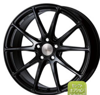
ベイント/ブラック (B) (ミドルコンケイブ) Kset仕様 19 FORGED