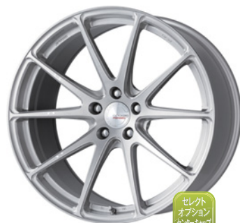
ブラッシュド (BRU) (ウルトラディープコンケイブ) 20 FORGED

TPMS The Pressure Monitoring System 対応 TPMS対応の詳細はP.273へ、