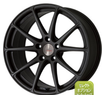
ブラックアライズド (SKA/B) (ディープコンケイブ) Kset仕様 19 FORGED