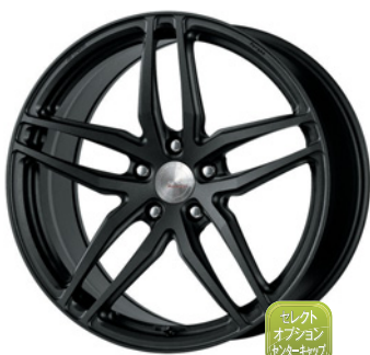
ブラックアノダイズ (SKA/B) (ディープコンケイブ) Kset仕様 20 FORGED