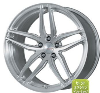
ブラッシュド (BRU) (ウルトラディープコンケイブ) 20 FORGED

TPMS The Pressure Monitoring System 対応 TPMS対応の詳細はP.273へ、