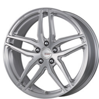
ブラッシュド (BRU) (ミドルコンケイブ) 19 FORGED