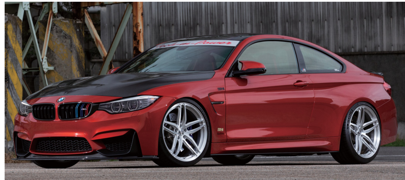
※装着画像はイメージです。