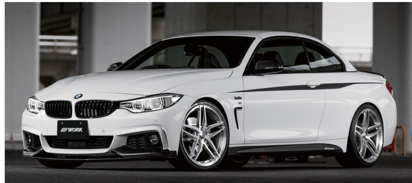
※装着画像はイメージです。

Repair Parts ●No.120239 センターキャップ ¥7,000/1個 (クロームメッキ) ●No.120240 センターキャップ ¥7,000/1個 (カットクリア)