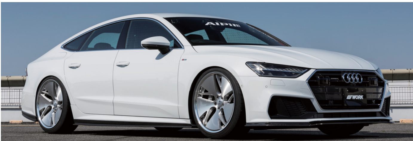
*装着画像はイメージです。