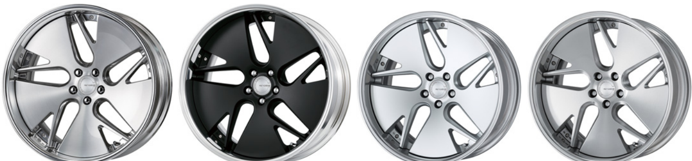
コンポジットハブブラッシュド (PBU) 21 (ディープコンケイブ)

TPMS The Pressure Monitoring System 2.0 TPMS対応の詳細はP.273へ。