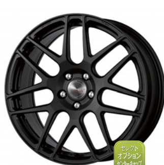
ブラックアノダイズド 19 (ミドルコンケイブ) Kset 仕様 FORGED