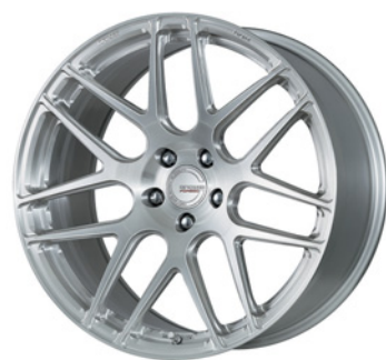
ブラッシュド 20 (ウルトラディープコンケイブ) FORGED

TPMS The Pressure Monitoring System 対応 TPMS対応の詳細▶P.281