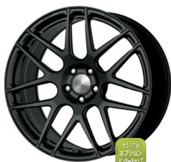
ブラックアノダイズド 20 (ディープコンケイブ) Kset 仕様 FORGED