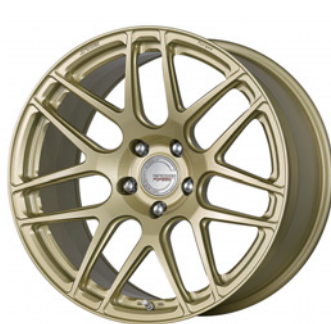
ペイント/プラチナゴールド 19 (ウルトラディープコンケイブ) FORGED