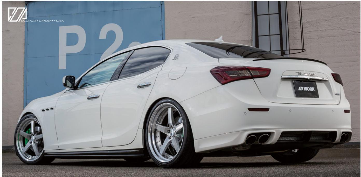
※装着画像はイメージです。