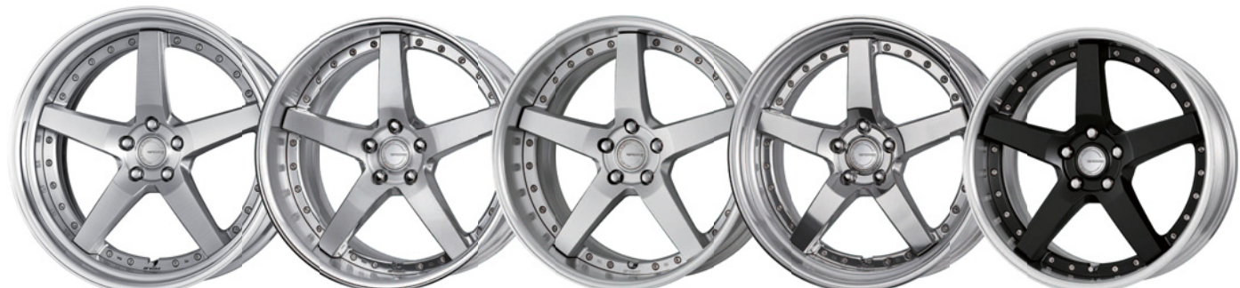
ブラッシュド SR 21