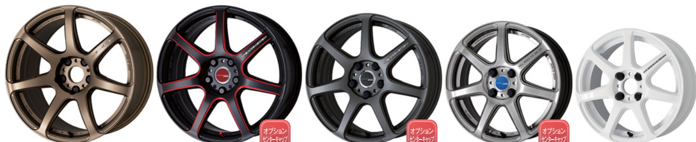
アッシュドチタン