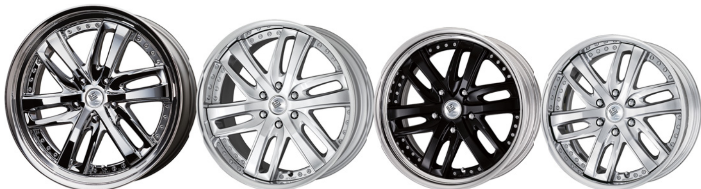
スーパークロームメッキ 24