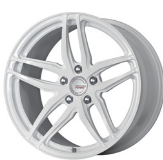
ベイント/ホワイト 19 (ウルトラディープコンケイブ)