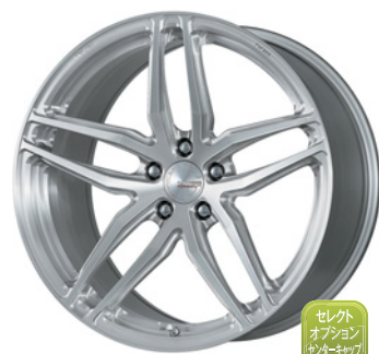
ブラッシュド 20 (ウルトラディープコンケイブ)

TPMS The Pressure Monitoring System 2.0 TPMS対応の詳細▶P.281