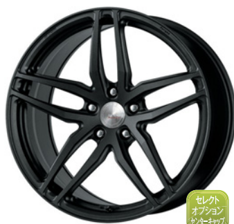
ブラックアノダイズド 20 (ディープコンケイブ) Kset仕様