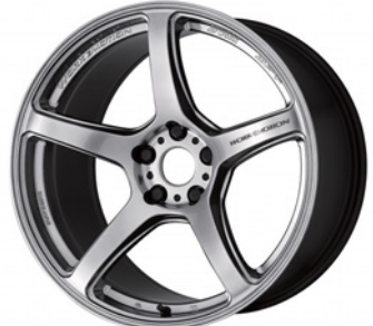
グロスシルバー 19 (ウルトラディープテーパー)