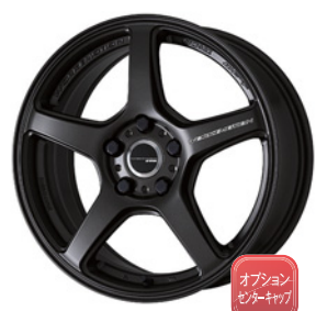
マットグラファイト 17 (セミテーパー)