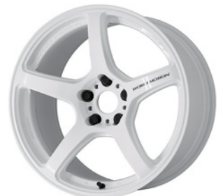
アイスホワイト 18 (ディープテーパー)