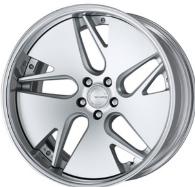
マットシルバー 20 (ディープコンケイブ)