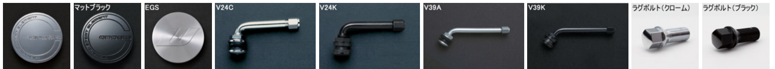
※ラグボルトの詳細について▶P.227