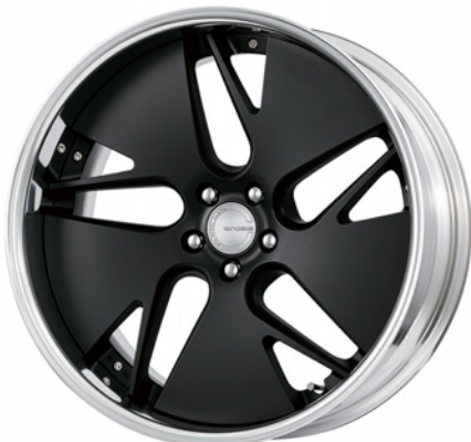
マットブラック 21 (ミドルコンケイブ)