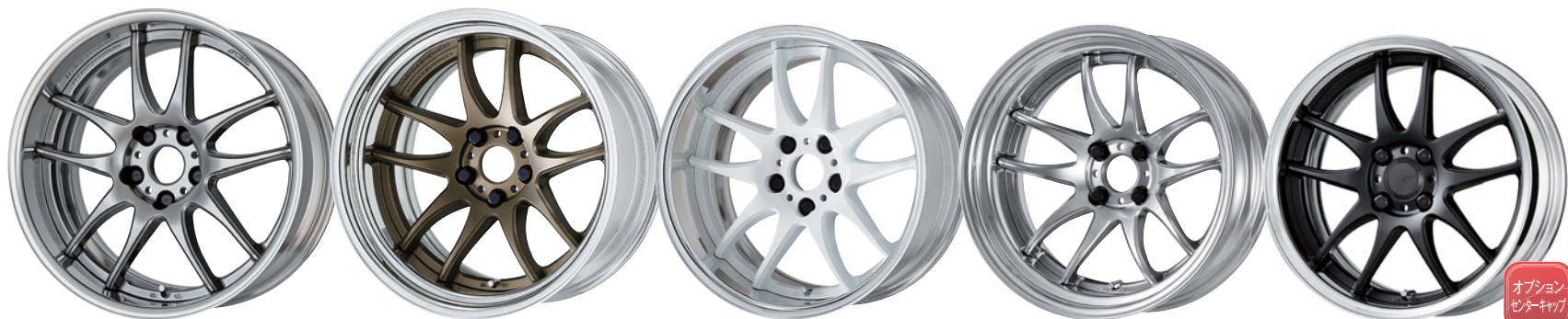
グリミットシルバー 18 (セミコンケイブ)