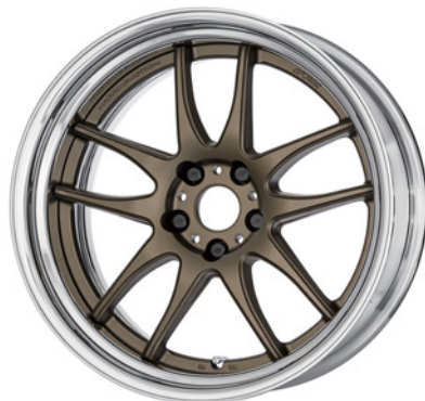
アッシュドチタン SR 19 (セミコンケイブ)