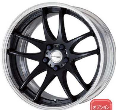
マットブラック SR 19 (ディープコンケイブ)