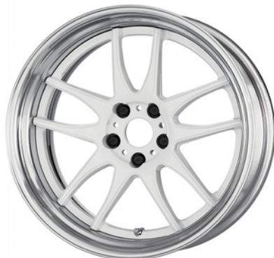
ホワイト SR 19 (セミコンケイブ)