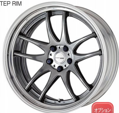
グリミットシルバー SR 20 (ディープコンケイブ)