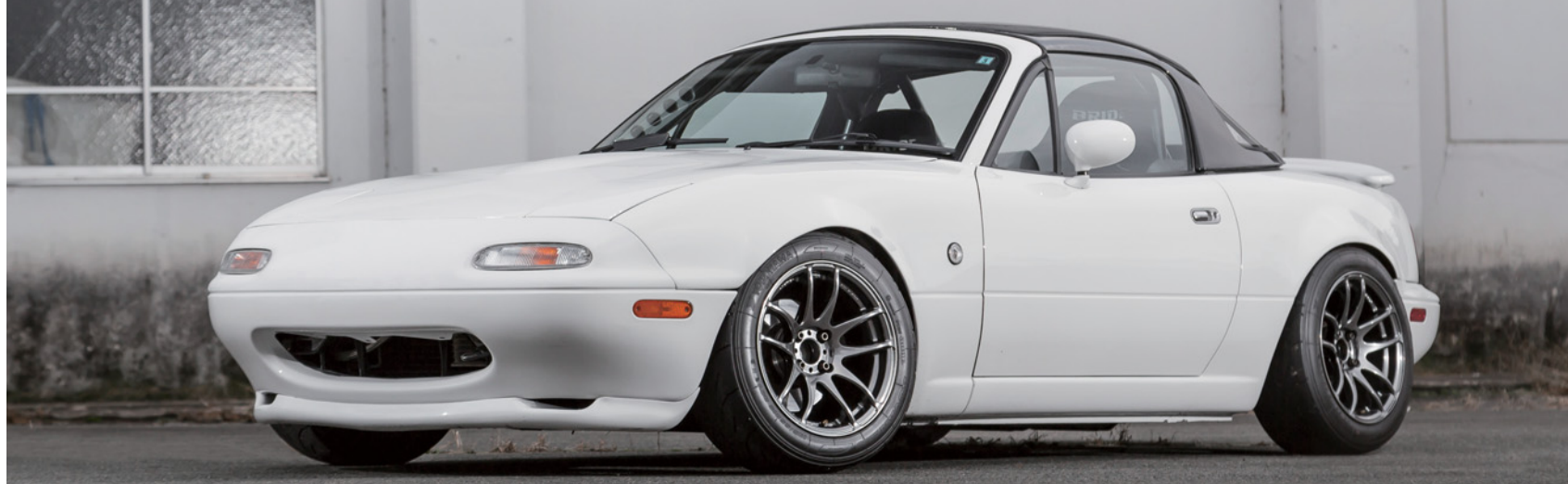
※表着画像はイメージです。