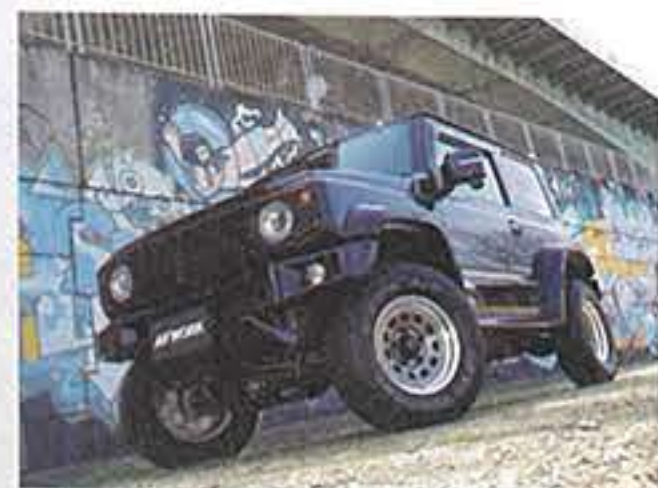
K.BREAK/ トランスグレーポリッシュ