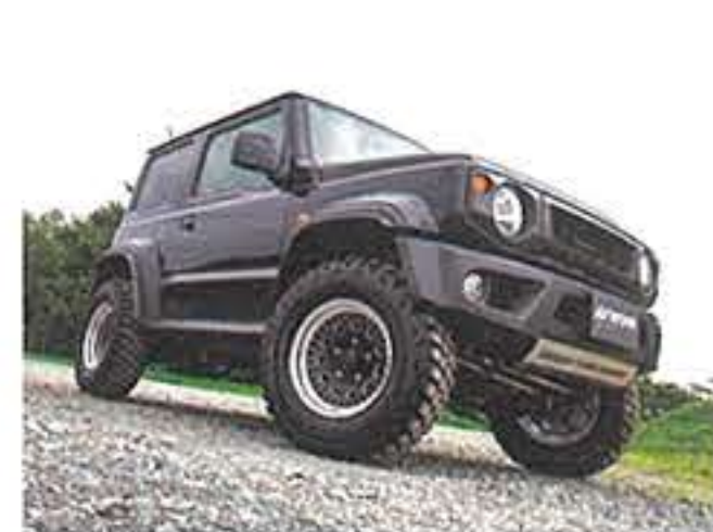
エヌズステージ/ ブラックシャンファーマシニング