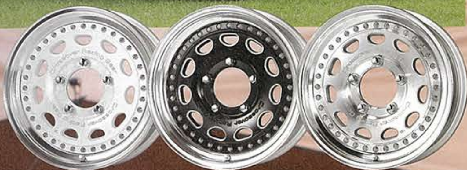
ホワイト ブラックシャワーマシニング カットクリア

右が標準色の「カットクリア」。左の2本はセミカラーオーダーで、それぞれ「ホワイト」と「ブラックシャワーマシニング」。なお、リムの標準設定はパパールマイトとなる。