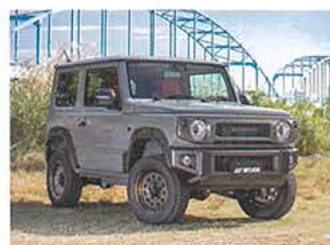
MATサービスファクトリー/ トランスグレーポリッシュ・ブラックピアス