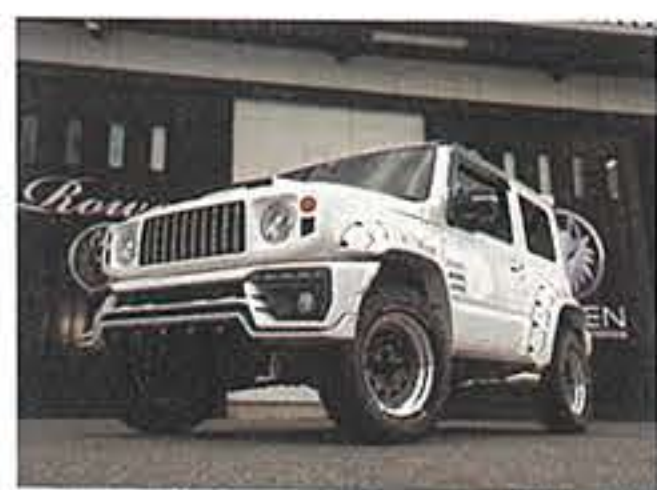
ROWEN/ ブラックシャンファークリアレッド