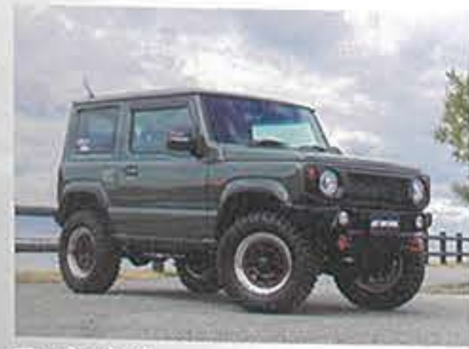
アーネスト/ ブラックシャンファークリアレッド