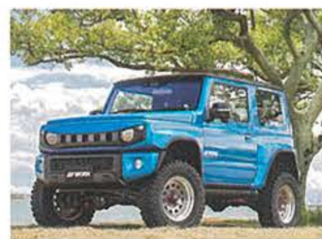
TAKE AUTO/ トランスグレーポリッシュ・ゴールドピアス

かつて一世を風靡したクラッグのエッセンスを感じさせながらも、イマのユーザーが求める「遅しさ」や「ワイルドさ」を感じさせるデザイン性も追求。それがここで紹介するクラッグ・ガルバトレだ。 ホイールの構造は、高度な製作技術が要求される3ピースを採用。煌びやかな雰囲気を出しながらも、もちろんだurableなオフロード走行にも耐えうる高い耐久性も両立しているのはWORKならでは。そのような4WDやSUVに求められる当たり前の性能をキチンと確保したうえで、ガルバトレが実現したのは、なんと1000通り以上の豊富すぎるとも言えるカラーバリエーションだ。 3ピースホイールは文字通りリムナーとアウターのリム、そしてディスクから成る3つの部品で構成されており、それぞれ異なる色を組み合わせて作る事が可能だ。そこに着目したのがガルバトレの最大の特徴で、エヌズのカラーはセミオーダーを含め25色も用意されており、リムのアレンジも6パターン設定。さらにピラスホルトも3色、エアバルブも2色ラインアップしており、さらにはRAV4やデリカD-5にも装着可能な5H・114・3サイズには、2種類のセンターキャップも設定。それらを掛け合わせると前述した通りの1248の組み合わせとなり、自分の愛車にベストな仕様を選び出すことができる。 それに加え3ピースの利点は、ふたつのリムサイズの組み合わせ次第