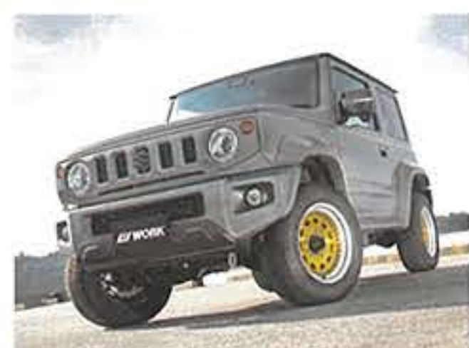
MATサービスファクトリー/ インベリアルゴールド・ブラックピアス