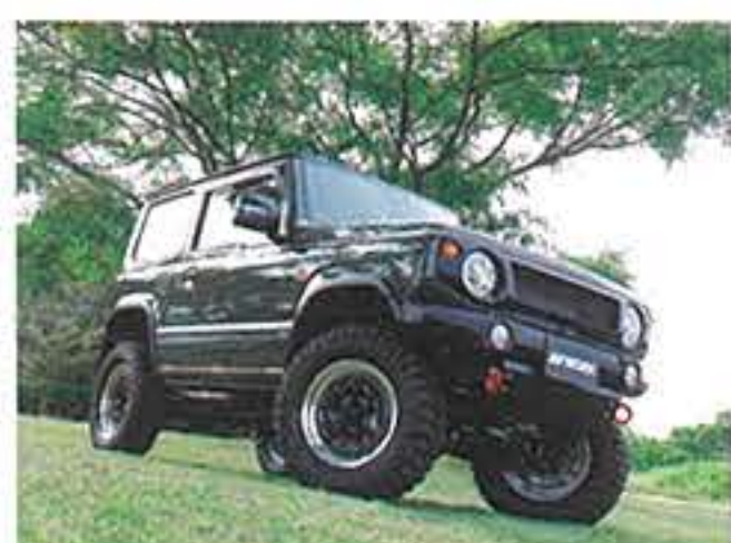
アーネスト/ ブラックシャンファーマシニング