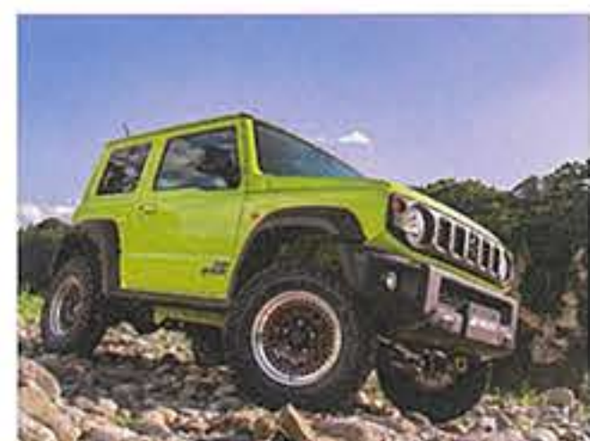
トライフォースカンパニー/ ブラックシャンファークリアレッド