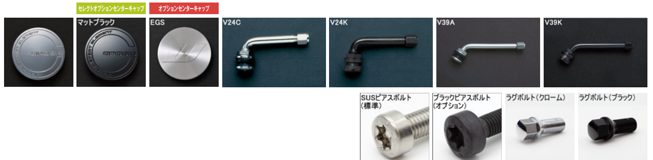
※ラグボルトの詳細について▶P.269