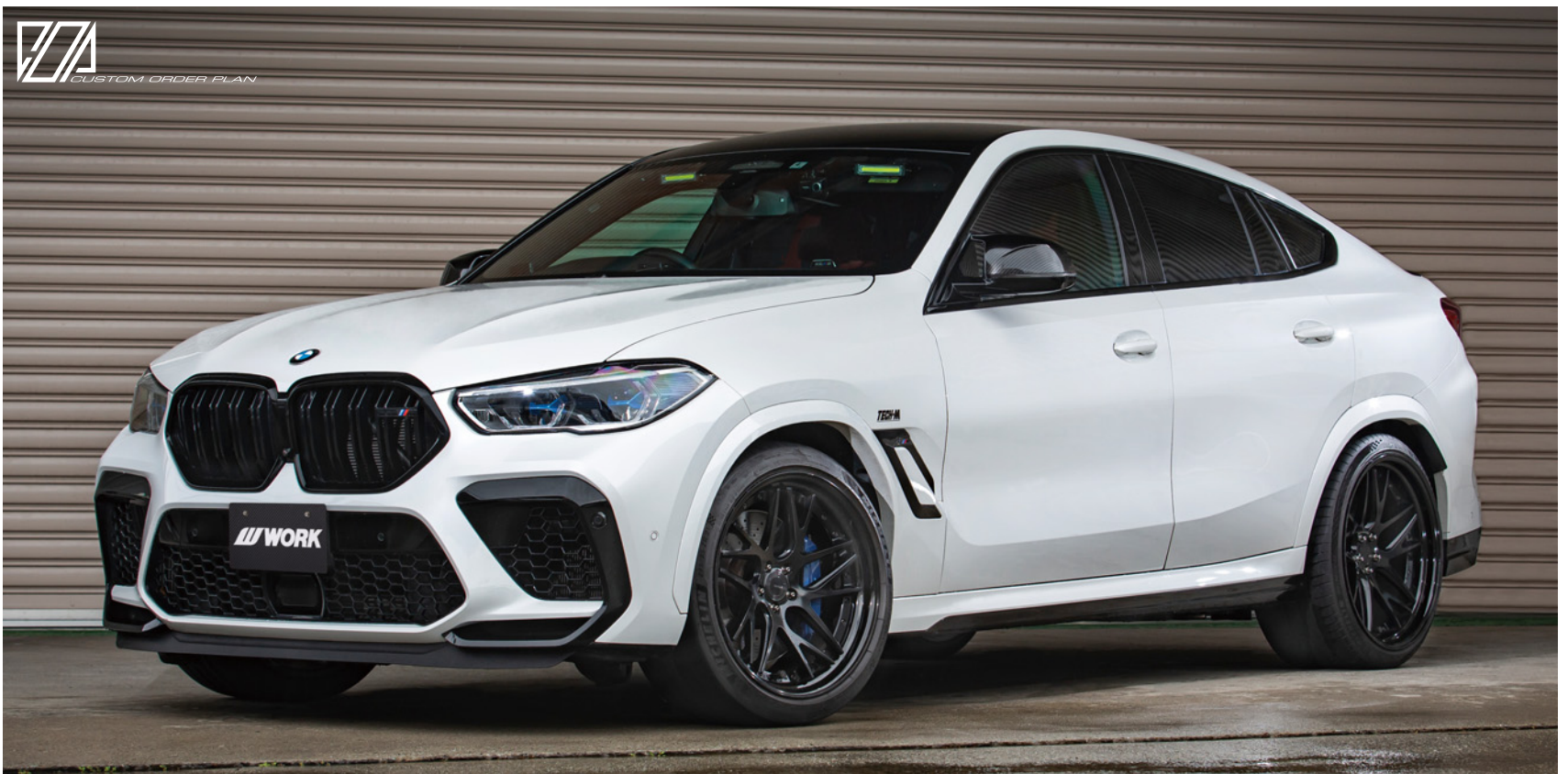
※装着画像はイメージです。