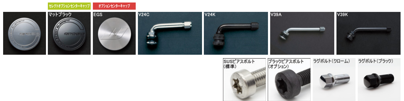
※ラグボルトの詳細について▶P.269