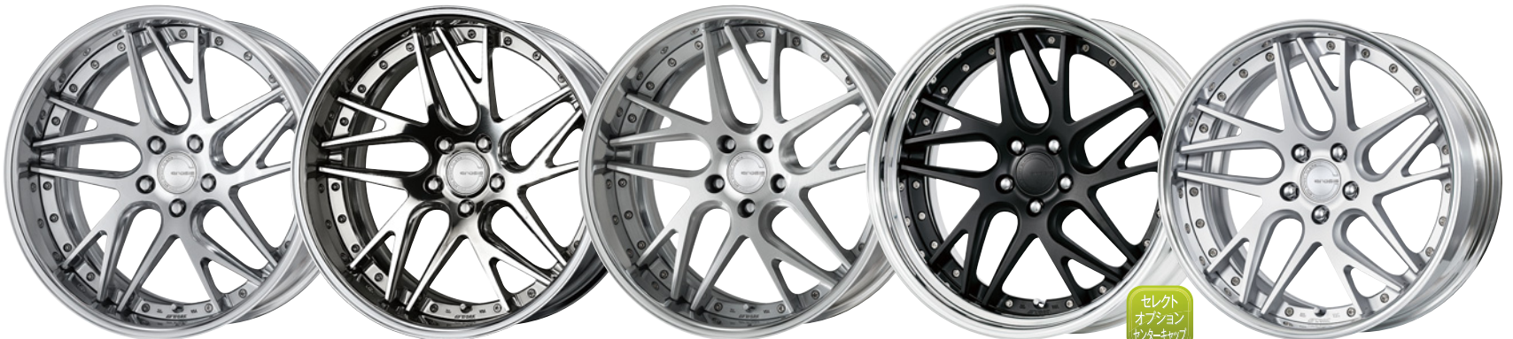
コンビジットパブラッシュド・PBU 20 (ディープコンケイブ)