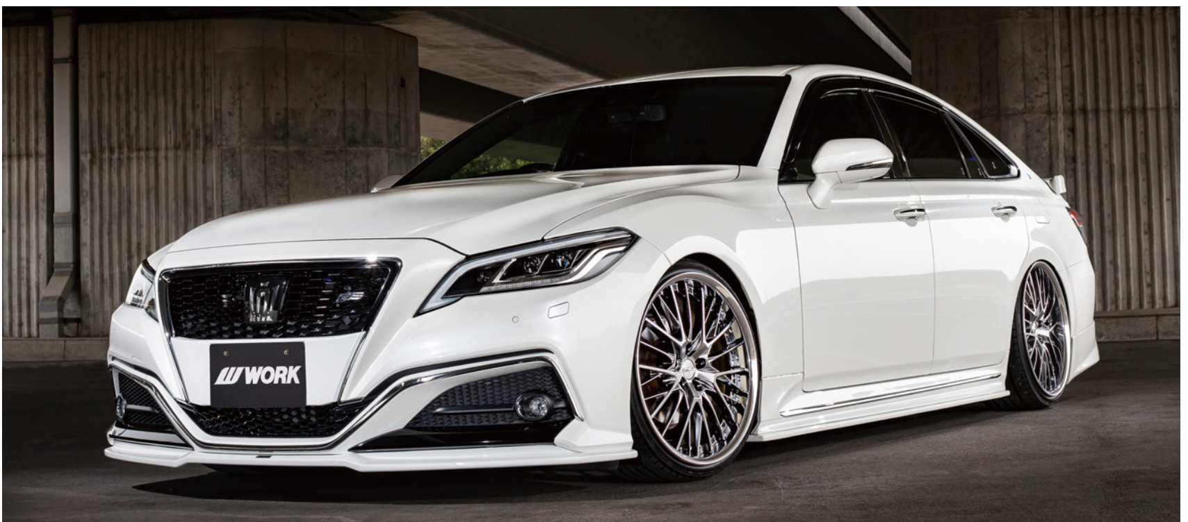
※装着画像はイメージです。