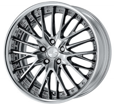
グリミットシルバー・GTS