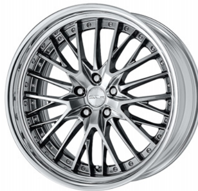
グリミットシルバー・GTS