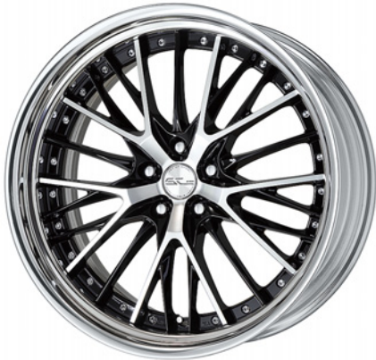
ブラックカットクリア・BP