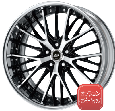
ブラックカットクリア・BP