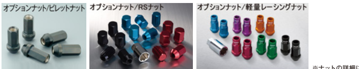
※ナットの詳細について▶P.268