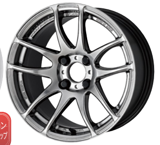
グリミットシルバー・GTS 15 (ディープテーパー)