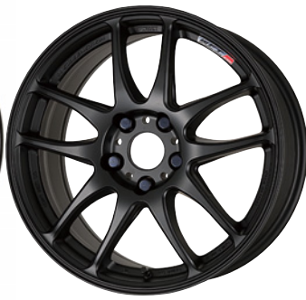
マットブラック・MBL 17 (セミテーパー)