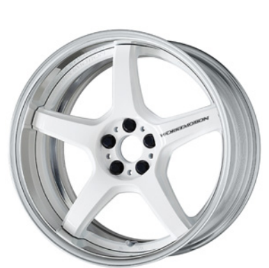
ホワイト・WHT 18 (ミドルコンケイブ)