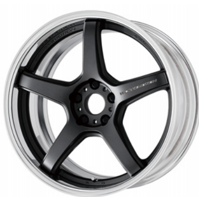
マットカーボン・MGM 19 (ミドルコンケイブ)