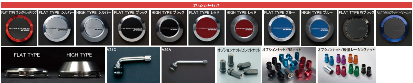
※ナットの詳細について▶P.268