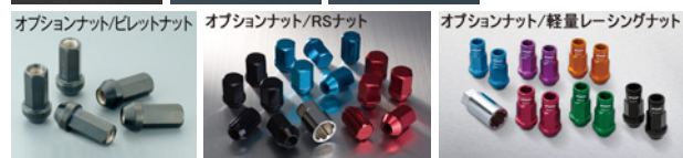
※ナットの詳細について▶P.268