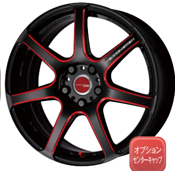
kurenai・BRM 18 (セミテーパー) (セレクトオプション:エアバルブレッド)