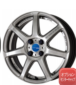
グリミットシルバー・GTS 16