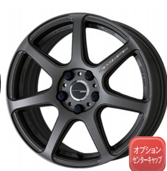
マットカーボン・MGM 17