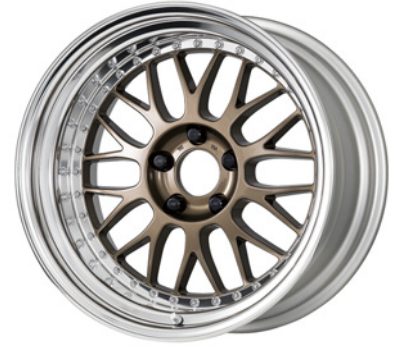
チタンゴールド・HPG