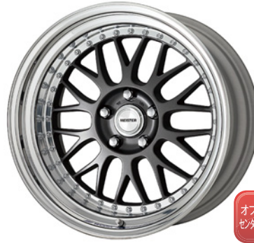
マットカーボン・MGM