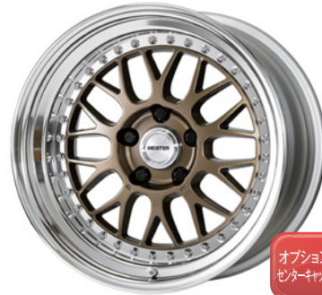
チタンゴールド・HPG