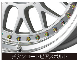
チタンコートピアスボルト