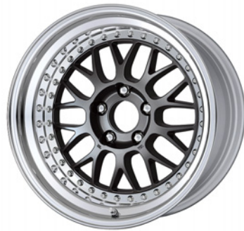
マットカーボン・MGM