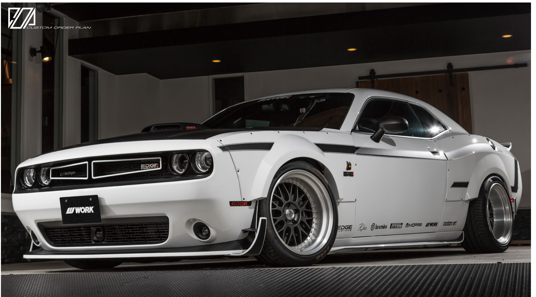
※装着画像はイメージです。