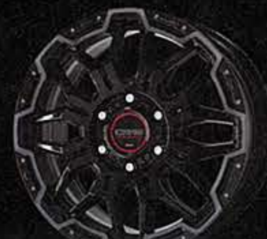
ブラックカットクリアブラックピアスマシニング