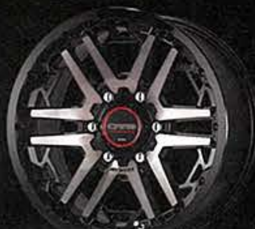
ブラッククリアグレー