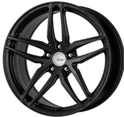
ブラックアノダイズド・SKB 20 (ディープコンケイブ) ブラックエアバルブ仕様 FORGED