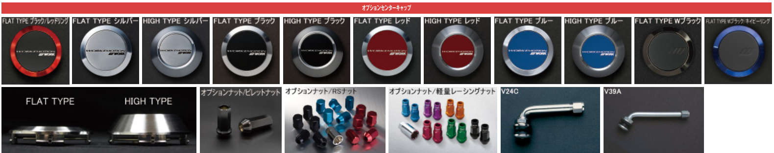
※ナットの詳細について▶P.262