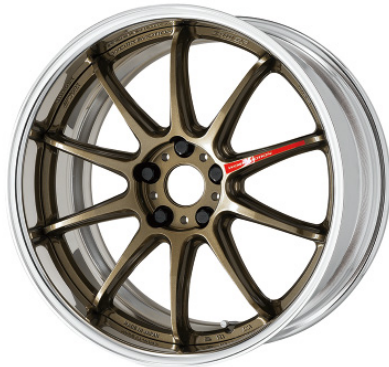
チャンブロンズ・HG SR 19 (ミドルコンケイブ)