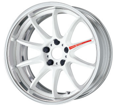
アズールホワイト・AZW SR 18 (ディープコンケイブ)