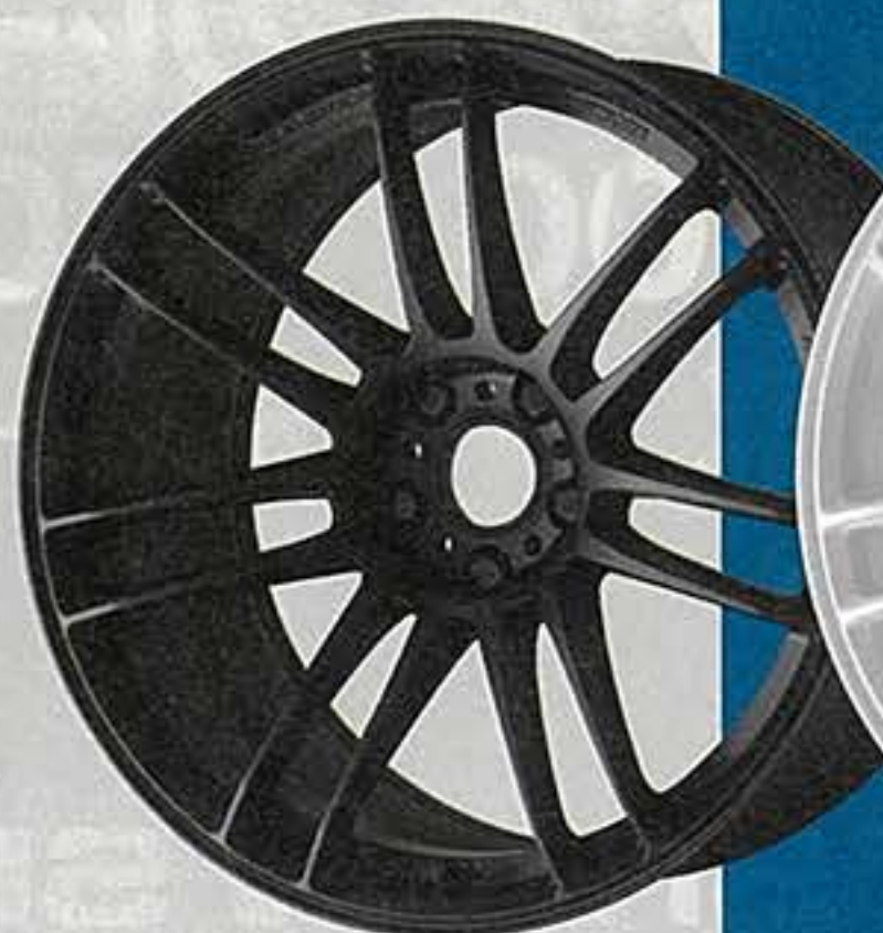
マットブラック・MBL

●鋳造の限界突破に挑む深いコンケイブと、ばね下の軽さを予感させる細身のツインスポーク、リム剛性を高めるスポーク先端の形状