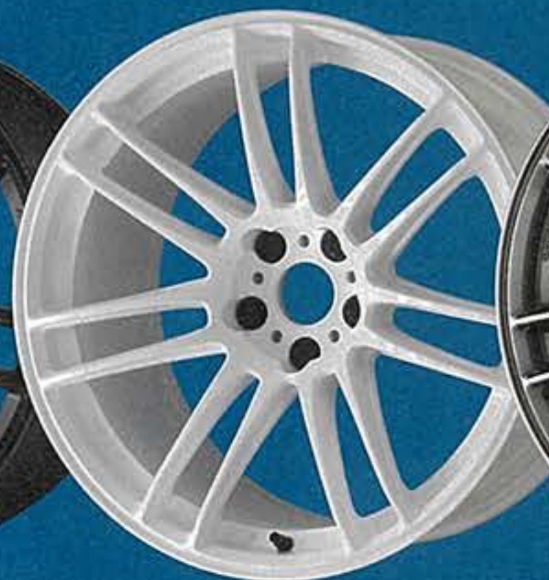
チタニウムホワイト・TW