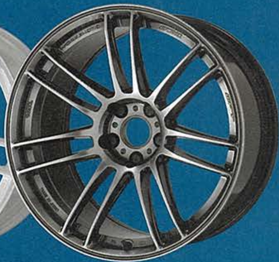
グローガンメタ・GGM