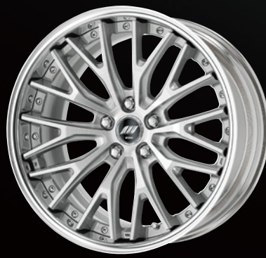
ブラッシュド・BRU 19 (ディープコンケイブ)