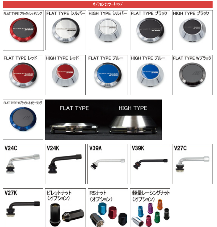
※ナットの詳細について▶P.236