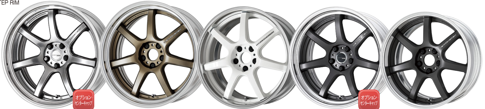
グリミットシルバー・GTS SR 20 (ディープコンケイブ)