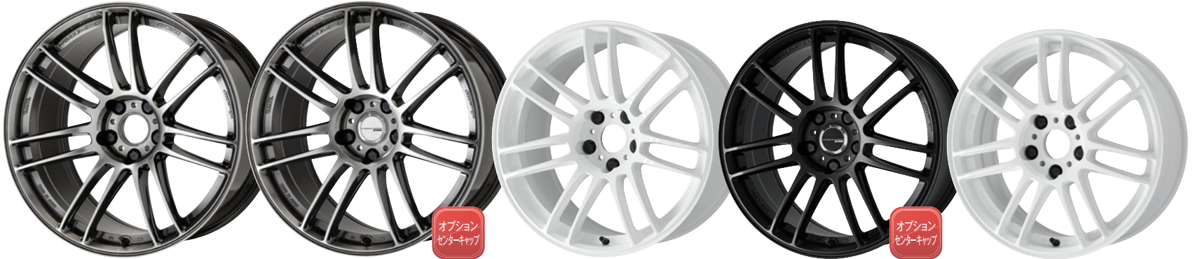
グロガンメタ・GGM 19 (ウルトラディープテーパ)

※標準P.C.D. 5H-114.3は 取付ボルトM14対応です (座面は60°テーパとなります)